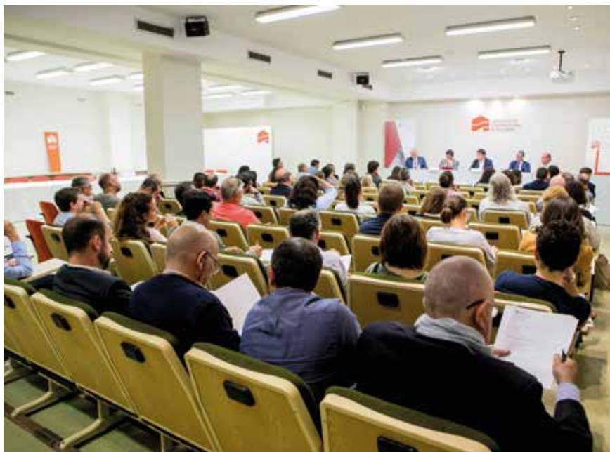
El ciclo de 'Jornadas Divulgativas de Prevención' ha despertado un amplio interés entre los empresarios y profesionales del sector en Baleares.

Posteriores jornadas del ciclo han centrado el foco en las consecuencias legales de un accidente de trabajo, analizando el recargo de prestaciones, la responsabilidad penal, la actuación inspectora, y en la importancia del seguro en la Responsabilidad Civil Patronal, coincidiendo todos los expertos en la relevancia de tener una suma asegurada en la póliza de Responsabilidad Civil que garantice esta cobertura, en especial, ante un proceso penal.