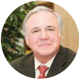
Juan F. Lazcano Acedo Presidente de la Confederación Nacional de la Construcción